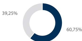
Die 10 größten Positionen in Prozent vom Gesamtportfolio

Die Top 10 Holdings werden in Prozent des Gesamtnettovermögens angegeben. Die Zusammensetzung des Fonds kann sich jederzeit ändern. Hinweise auf bestimmte Wertpapiere sollten nicht als Empfehlung zum Kauf oder Verkauf oder als Aussage über deren Gewinnpotenzial verstanden werden.