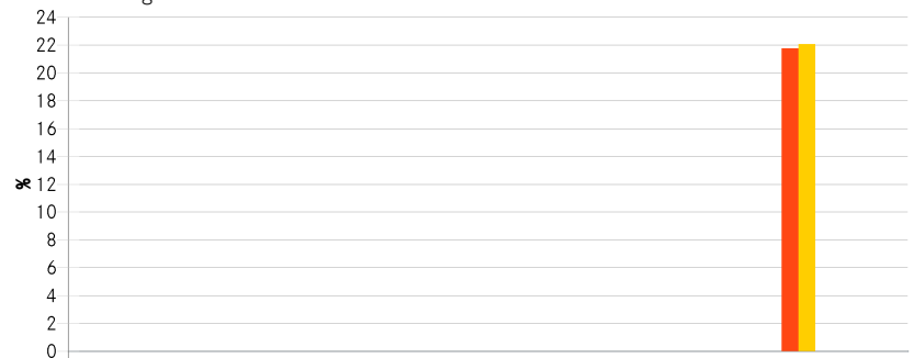
Historische Wertentwicklung bis zum 31. Dezember 2021

† Referenzindex:STOXX Global Smart City Infrastructure (USD)