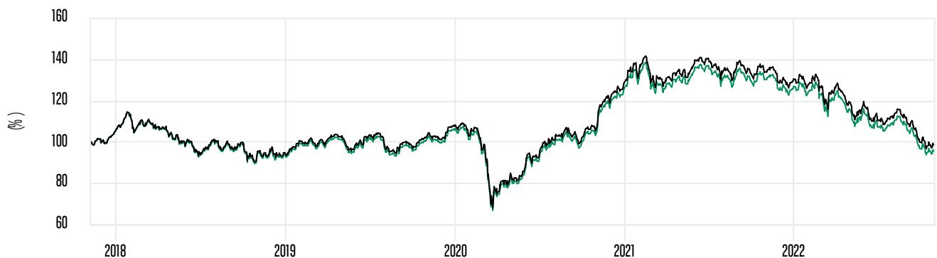
Kumulierte Wertentwicklung per 31.10.2022 (in %)